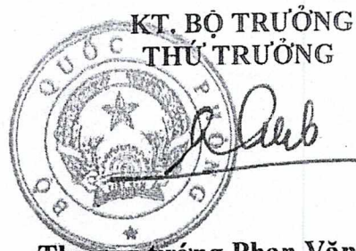
Thượng tướng Phan Văn Giang

2. Thường xuyên cập nhật những nội dung mới về đường lối, quan điểm của Đảng, chính sách pháp luật của Nhà nước và địa phương về nhiệm vụ quốc phòng, an ninh để biên soạn giáo án, bài giảng phù hợp với từng đối tượng bồi dưỡng./. me